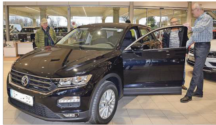
Der T-Roc bietet umfangreiche Assistenzsysteme und individuelle Ausstattung. Foto: jure

und das Umfeldbeobachtungssystem. Das geländegängige Fahrzeug ist mit verschiedenen Motoren und Allradantrieb erhältlich. (jure)